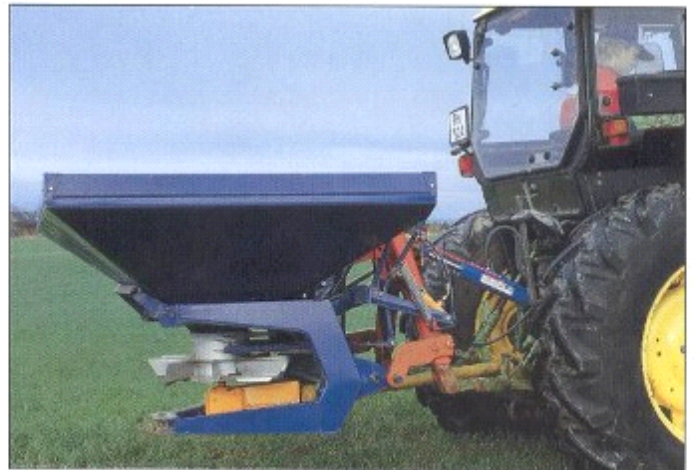
Eine sichere und einfache Verbindung zwischen Traktor und Landmaschine