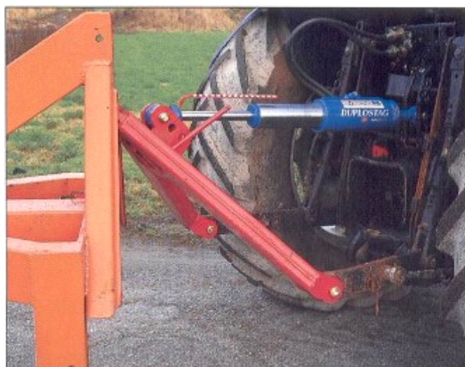
Teleskopoberlenker am Schnellwechsler ermöglicht die schrägwinklge Ankopplung