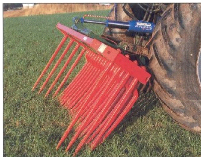
Die große Schlaglänge ermöglicht unterschiedliche Arbeitswinkel und erhöht die Landmaschinennutzung

Teleskopoberlenker ausgerüstet mit Sicherheitsventil