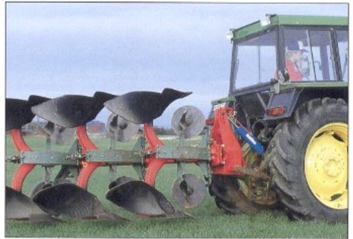
passend zu großen Traktoren mit schweren Landmaschinen